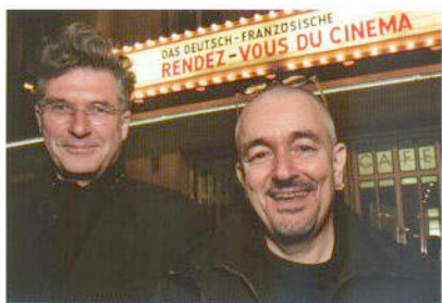
Deutsch-Französisches Filmtreffen: Die Regisseure Peter Sehr (l.) und Jean-Jacques Beineix vor dem ARRI Kino in München

Eine ausführliche Dokumentation des Medienkongresses mit Text-, Bild- und Audiomaterial findet sich unter www.medientage.de .